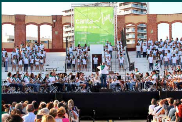
'L'Escola Canta', una gran festa escolar i musical al 'Vinaròs Arena'