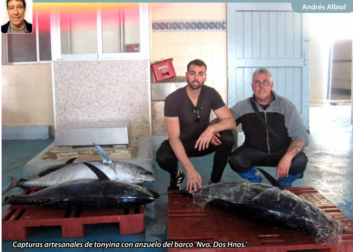
Capturas artesanales de tonyina con anzuelo del barco 'Nvo. Dos Hnos.'