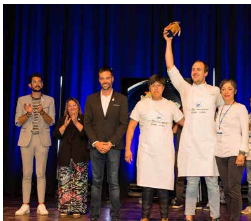
Llagostí d'Or Restaurant Venta da Posa

En els parlaments, l'alcalde de Vinaròs, Guillem Alsina, va destacar que "el llagostí és el producte amb el que la ciutat aconsegueix un valor afegit a la seua oferta turística, gràcies al bon tractament dels restauradors". I va voler subratllar la importància del sector pesquer "perquè això no seria possible sense la feina d'uns treballadors que cada dia surten a la mar per aconseguir les millors captures", una feina que va recordar que va continuar tot i la pandèmia per garantir el subministrament a les cases.