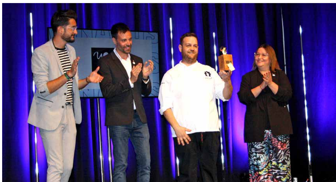
El restaurant Teruel, guanyador del premi popular de les jornades de cuina de llagostí