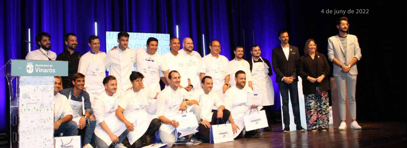
Els 10 restaurants participants, amb l'alcalde Guillem Alsina,, la diputada Ruth Sanz i el regidor d'Interès Turístic, Marc Albella