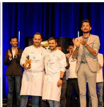
Llagostí de Plata Restaurant Citrus Tancat