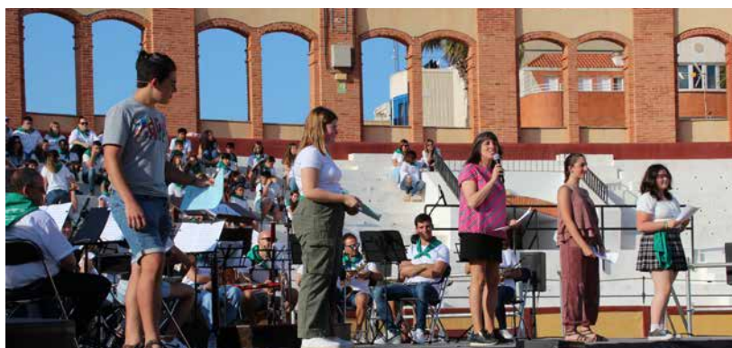
Los de Teatrèmol presentando

Mis felicitaciones a todos los que intervinieron en este gran espectáculo.