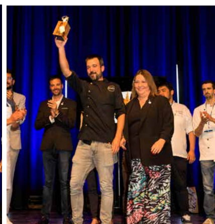
Llagostí de Bronze Restaurant Gaudir