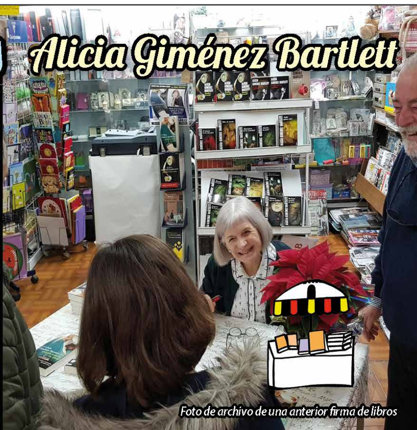
Foto de archivo de una anterior firma de libros

Pl. Jovellar, 15 - VINARÒS - Tel.: 964 45 17 38 - ☎ 682 52 37 93