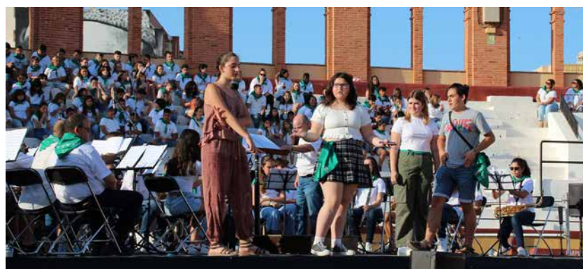
Actuación de Teatrèmol