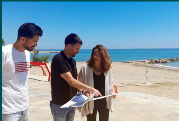
Costes renovarà les esculleres del Fortí amb una inversió de 728.000 €