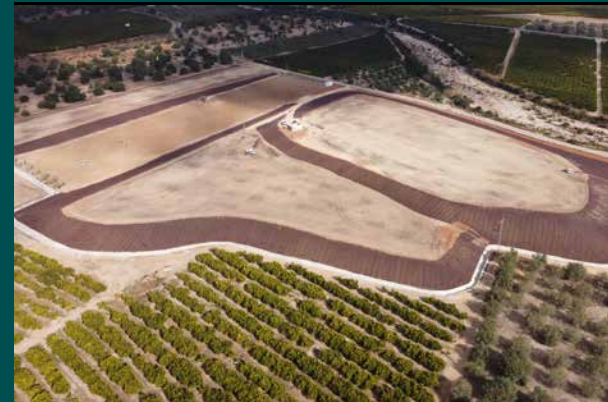
Conclouen les obres de segellat de l'antic abocador